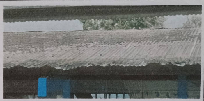
Foto 2: Estas laminas se encuentran de deterioradas y completamente picadas