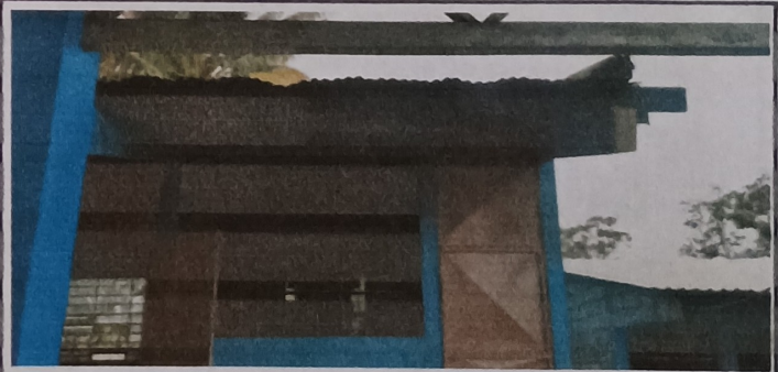
Foto 6: Laminas descañadas y de deterioradas en el modulo de la direccion.

Observación: Si es necesario se pueden agregar hojas adicionales y actualizar el número de hojas.