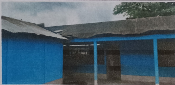
Foto 3: con años de servicio las mallas son un colador en invierno filtran agua